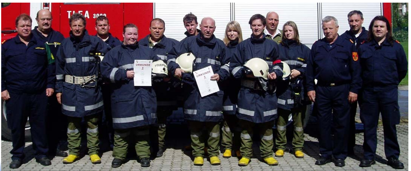
Bild: Ausbildungsprüfung Löscheinsatz

Ergibt einen Gesamtzeitaufwand von 1436 Stunden für das Feuerwehrwesen 2009